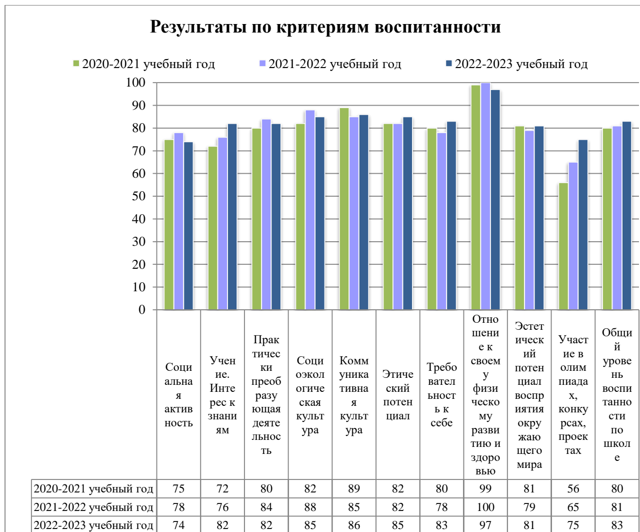
Гистограмма 2. Результаты по критериям воспитанности

Сравнительный анализ уровня воспитанности по направлениям по годам представлен в гистограмме 2. (все данные представлены в %). Представлена наглядно динамика изменений уровня воспитанности по направлениям.